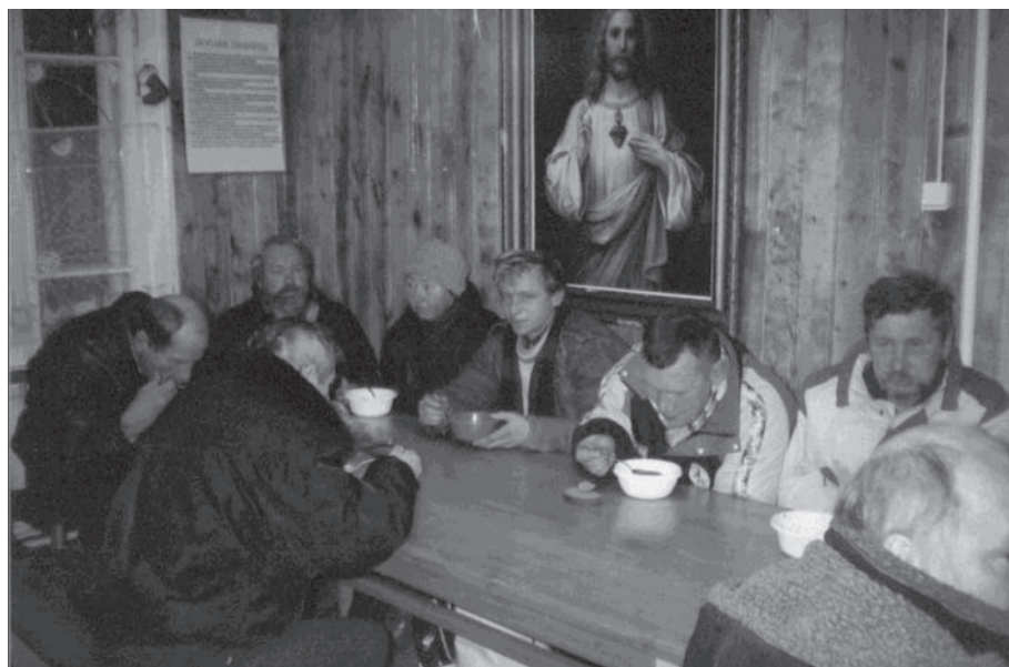
Pietūs parapijos Carito valgykloje