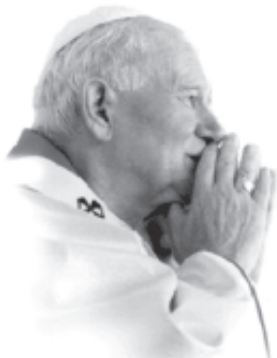
POPIEŽIUS JONAS PAULIUS II (Karolis Wojtyła)

Kauno Kristaus Prisikėlimo parapijos laikraštis