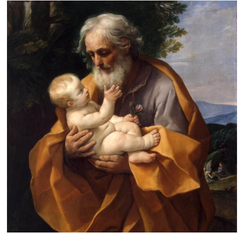
GGuido Reni, „Šventasis Juozapas su Kūdikėliu Jėzumi“ (c. 1620 m., drobė, aliejus).

Vyriausybė Tėvo dienos, kaip valstybinės šventės, paskelbimo klausimu norėjo pareikšti savo nuomonę 2007 m. vasarį, tačiau jis buvo išbrauktas iš darbotvarkės, nes, pasirodo, Finansų ministerijai nepatiko papildomų šventinių dienų idėja, net jei jos sutampa su savaitgaliais, kadangi šventinę dieną valstybės biudžetas praranda dalį pajamų.