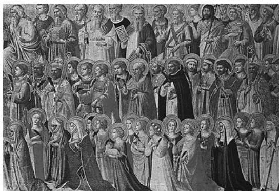
Visų šventųjų diena (Fra Angelico paveikslas, XV amžius)

Ketvirta, gailestingieji – tai tie, kurie