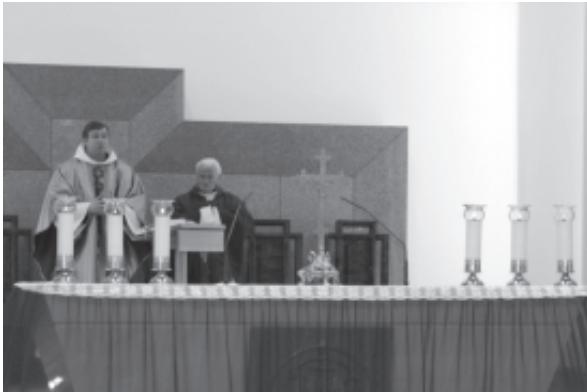
Atkelta iš 3 p.

tiems, kurie nori gyventi šventai, nors ne visada tai pavyksta, nori mylėti, nors ne visada išeina, nori būti gailėstingi, nors ne visada sugeba.