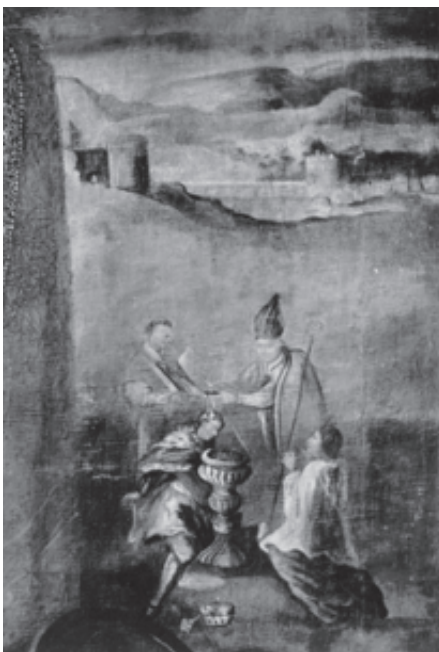
Mindaugo krikštas. Nežinomas dailininkas, XVII a.