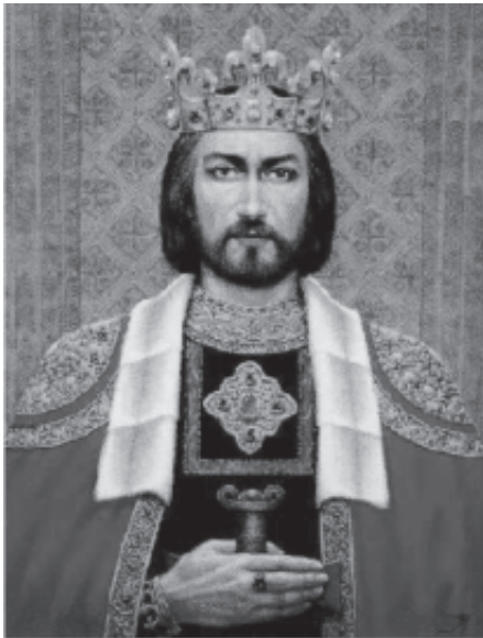
Mindaugas. Dail. J. Malinauskaitė, 1989 m.

Mieli tikintieji, Kristus, siūsdamas apaštalus skelbti Dievo karalystę, jiems patikėjo savo darbą – skelbti Evangeliją, gydyti ligonius bei vaduoti velnio apsestuosius. Tikėdami Jėzumi bei Jo meilės įkvėpti, jie pakluso ir todėl Jėzaus vardu galėjo daryti neįtikėtinus stebuklus (plg. Mk 6, 13). Taigi šie paprasti žmonės buvo įgalinti nepaprastais darbais. Pakrikštyti Kristuje, mes taip pat buvome išrinkti ir „siunčiami“ skelbti gerąją Jėzaus naujieną kitiems. Ar tikite, kad Dievas jus, paprastas žmones, gali kvieisti kurti meilės karalystę bei teisingumą nuodėmės sužeistame pasaulyje? Ar tikite, kad Dievas palaimino jus „visokeriopa dvasine palaima“ (Ef 1, 3)? Tikėkite Dievo kvietimu ir stenkitės atsiliiepti! Pasitikėkite Dievo žodžiu ir būsite išganyti.