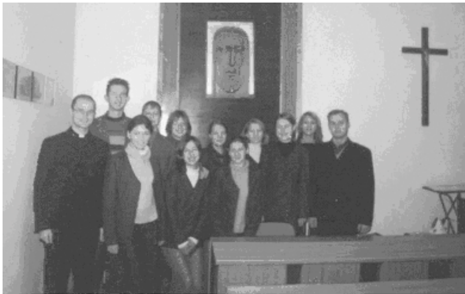
Saulės gimnazijos ateitininkų kuopa gimnazijos tikybos kabinete